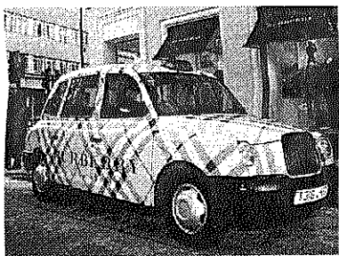
バーバリーチェック柄のタクシーで旗艦店に乗り付けるロンドンっ子も

ロンドンの高級ブランド店街、リー」の旗艦店が好調だ。売り場面積は約千五百平方メートルで三階建ての同店は、一階がアクセサリと